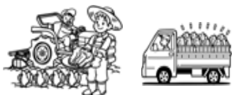
食材を作ってくださいる人