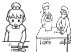
準備してくれる人