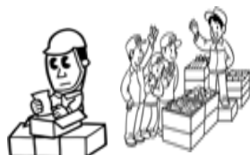
食品の流通市場で働いてる方