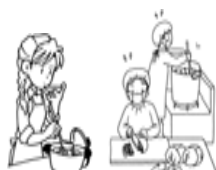
料理を作ってくださいる

11月23日は勤労感謝の日。私たちの生活に食事はなくてはならないものです。毎日の食事はたくさんの人のおかげで頂くことができます。感謝の気持ちを忘れてはいけませんね。